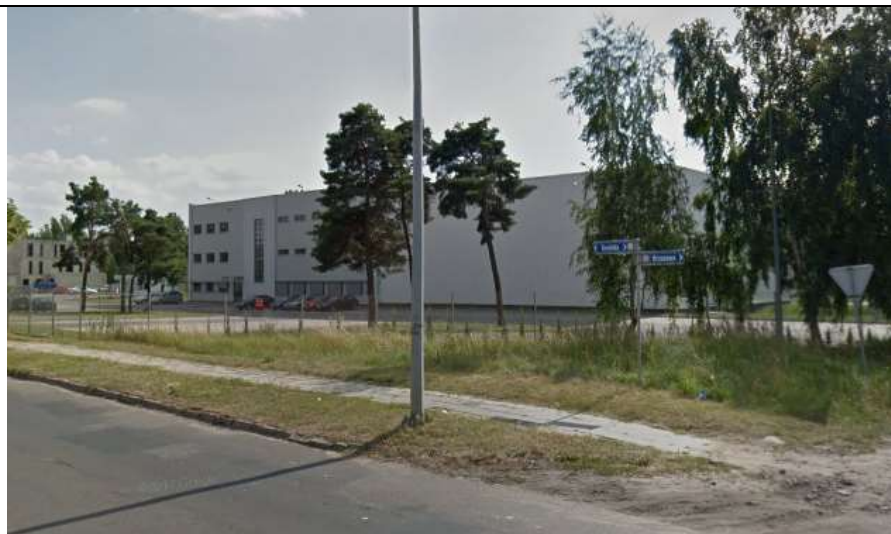
Fot. 9 Widok na budynki zakładu produkcyjnego, widoczne z ul. Toruńskiej.