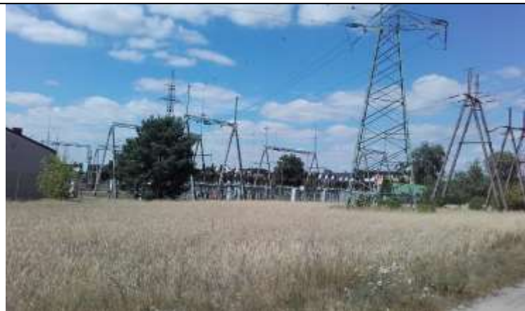
Fot. 3 Widok na zespół transformatorów sąsiadujących z obszarem opracowania.