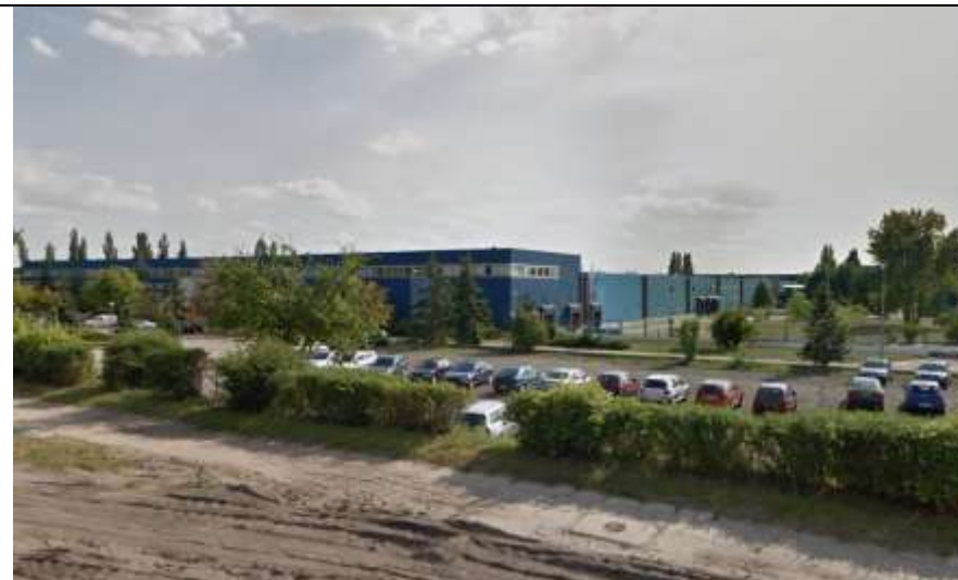
Fot. 11 Widok na budynki zakładu produkcyjnego znajdujące się w południowo-wschodniej części analizowanego terenu.