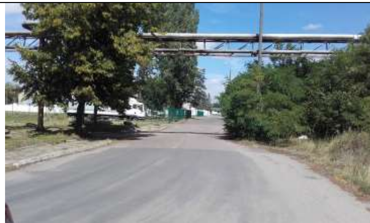
Fot. 4 Widok z drogi znajdującej się w granicach opracowania w kierunku zachodnim.