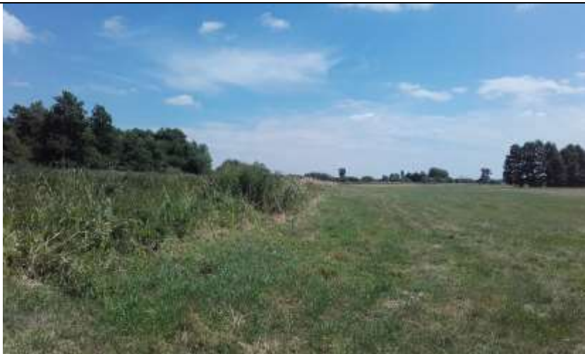
Fot. 5 Widok na tereny niezainwestowane, zlokalizowane w południowej części opracowania.