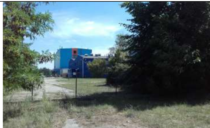
Fot. 2 Widok na budynki produkcyjne znajdujące się na działce nr 15/40.