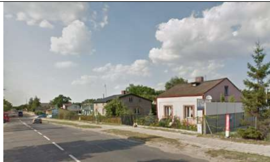
Fot. 12 Widok na budynki mieszkalne przy ulicy Toruńskiej.