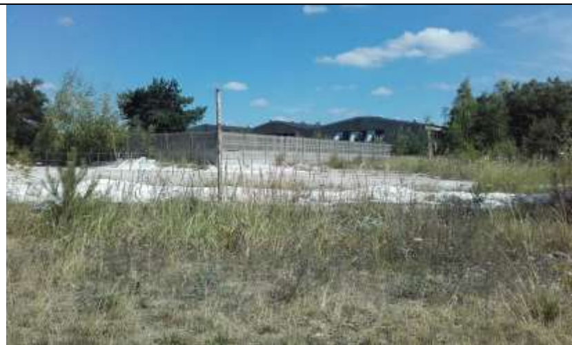
Fot. 7 Widok na budynki zlokalizowane na dz. nr 15/32.