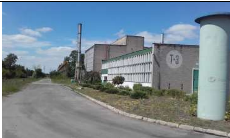
Fot. 1 Widok na budynki produkcyjne przy ulicy Zachodniej.