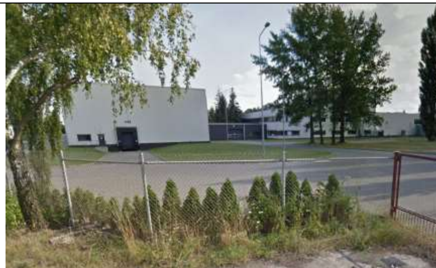
Fot. 10 Widok na budynki zakładu produkcyjnego, widoczne z ul. Brzozowej.