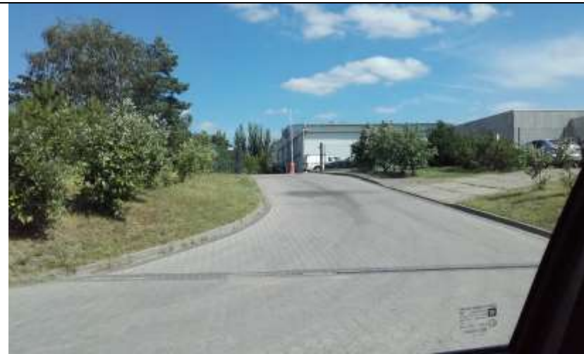
Fot. 6 Widok na budynki produkcyjne, przy ulicy Zachodniej.