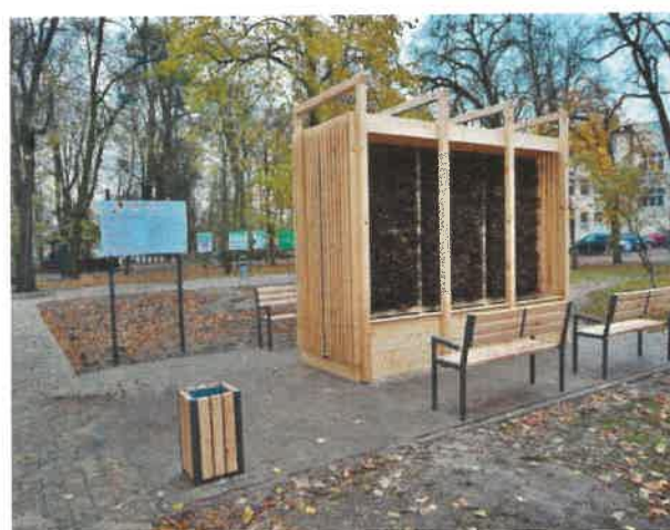
Tężnia solankowa wraz z infrastrukturą towarzyszącą