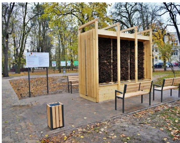
Tężnia solankowa wraz z infrastrukturą towarzyszącą