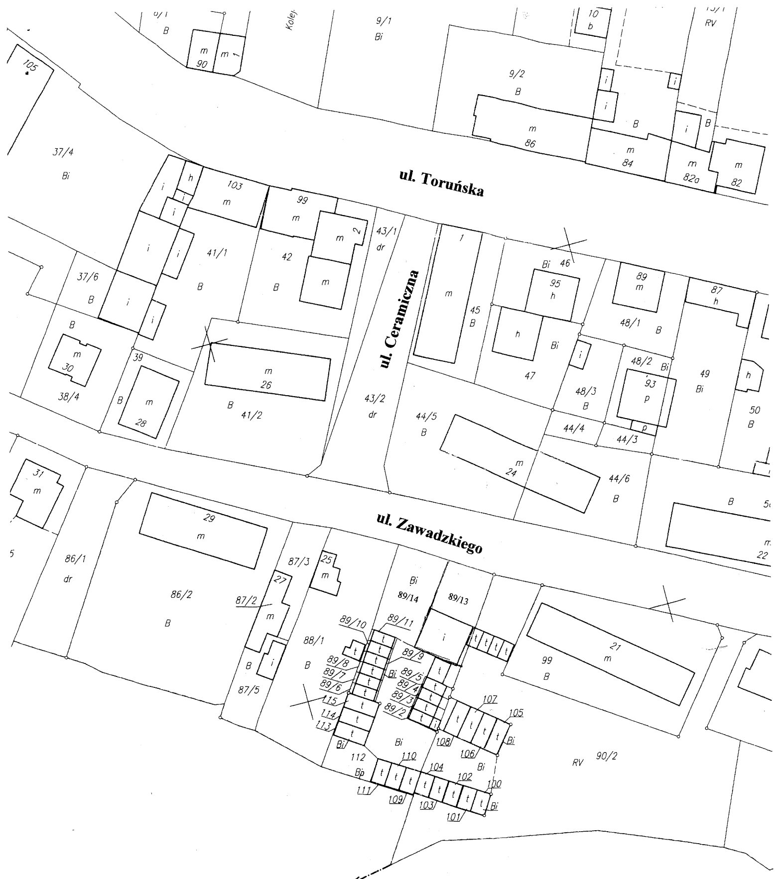
ark. mapy 22