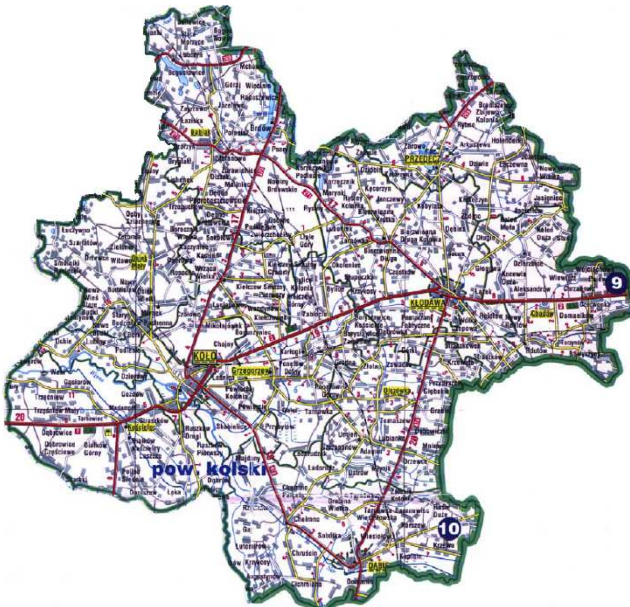
Rysunek 2 Gminy należące do Związku Międzygminnego „Kolski Region Komunalny”.

Do Związku Międzygminnego „Kolski Region Komunalny” należą wszystkie gminy powiatu kolskiego. Region położony jest we wschodniej części województwa wielkopolskiego. Graniczy od zachodu z powiatem konińskim i tureckim województwa wielkopolskiego a od wschodu z gminami województwa kujawsko-pomorskiego i łódzkiego.